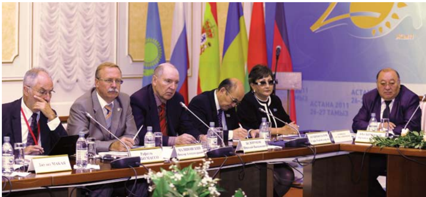
На международной научно-практической конференции, посвященной 20-летию Конституции РК «Конституция: единство, стабильность, процветание». Август 2015 г.

В 2010-2012 гг. работал директором государственного учреждения «Институт законодательства Республики Казахстан» Министерства юстиции Республики Казахстан.