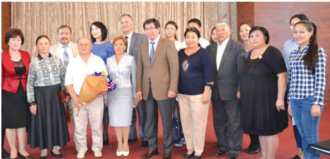
После выступления, посвященного 550-летию Казахского ханства перед преподавателями Атырауского государственного университета им. Х.Досмухамедова. 25 сентября 2015 г.

проводится анализ перспектив Евразийского союза, его потенциальных участников, со своими политическими, экономическими интересами. Акцентируется внимание на казахстанское видение, по которому в Евразийском союзе «должны быть представлены те государства, для которых стержнем интеграции должна стать сама евразийская идея как духовное начало, тысячами нитей пронизывающее их прошлое, настоящее и будущее». 3 Автор обосновывает идеи не только о необходимости Евразийской декларации прав человека и народов, как международного документа, распространяющегося на евразийском континенте, но и о создании Евразийского Суда по правам человека, как «показателя жизнестойкости самого Евразийского союза». 4