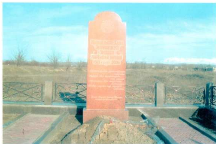
Зинаш (Зейнепгүлсін) шешейдің мүрдесі басындағы ескерткіш тас. 2005 жыл, Еркін ауылы.