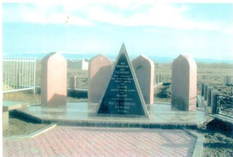
Нәрікбаевтар әулетінің зираты.