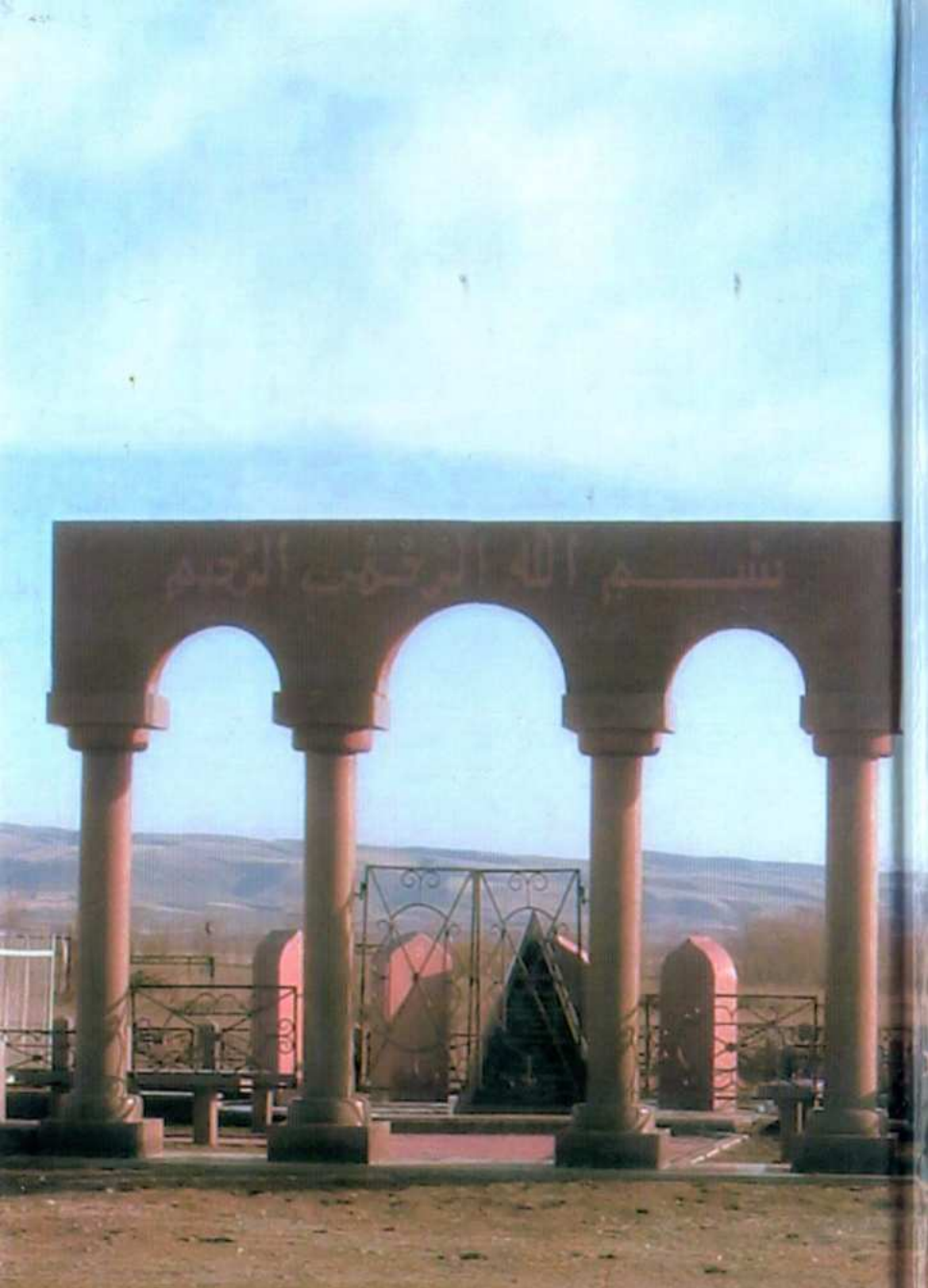
Нәрікбаевтар әулетінің зираты.