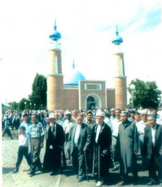
“Еркін” мешітінің ашылған күні. 2004 жыл, 27 тамыз.