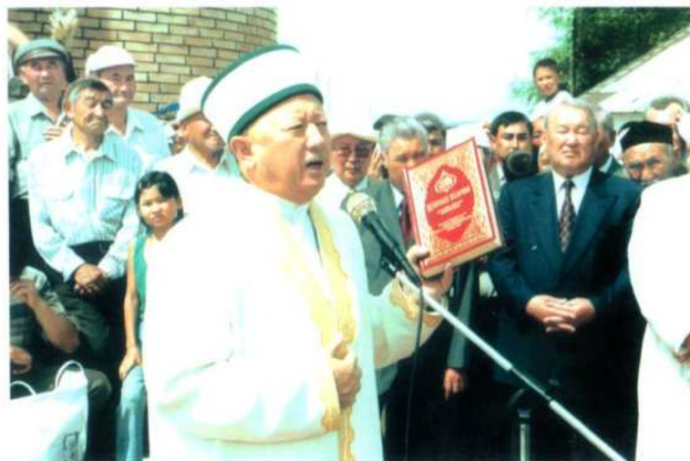
Бас муфти Әбсаттар Дербісәлі “Еркін” мешітіне “Құран кәрімді” сыйлап тұр. 2004 жыл, 27 тамыз.