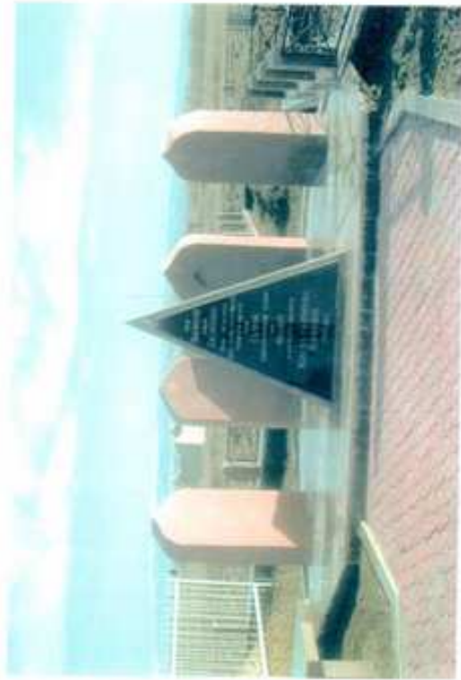
Нұр-Сұлтан қаласының зираты.