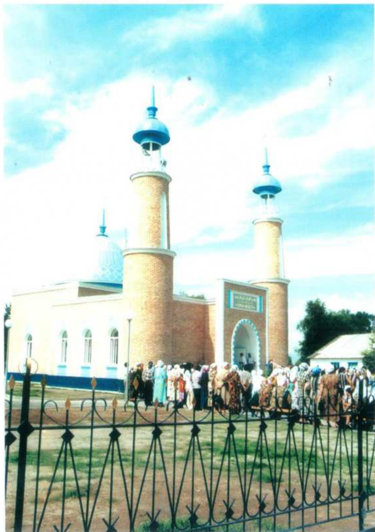
“Еркін” мешітінің алды. 2005 жыл. 10 мамыр. Зинаш (Зейнепгүлсін) шешейдің жаназасы оқылу сәті.