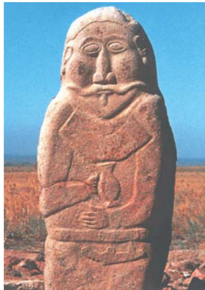
Каменная скульптура кок-тюркского батыра

ления императора Вын ди. На самом деле, император Вын ди взошел на престол в 531 г., поэтому дипломатические сношения и военное покорение 50 тысяч телз относятся к 546 г. На 17 году правления Вын ди Бумынь получил в жены принцессу Шанлы, т. е. в 548 г. По китайским справочникам достоверно установлено, что император Вын ди умер в 551 г., и данная дата обосновывает время основания «Тюрк Эля», поскольку в том же «Чжоу шу» даётся следующая привязка: «... в первом месяце первого года правления (следующего. — Т. Ж.) императора Вэй Фи-ди Бумынь направил свои войска против жужан, и в местности Хуэй-хуан полностью их разгромил», после чего провозгласил себя «Или (Эль) каганом», а свою супругу «Катун» 32 . Большое количество историков вслед за Н. Я. Бичуриным считает, что данное событие произошло уже 552 г. Но император Вынь ди умер не на христианский новый год, а весной, т.е. «первый месяц первого года...» правления императора Фи-ди, это продолжение 551 г. Большинство историков и очевидно, сами кок-тюрки именно с событий 551 г. отсчитывают основание I Тюркского каганата. Мы считаем эту дату установленным историческим фактом, и, это лишь один из вопросов хронологизации истории кок-тюрков.