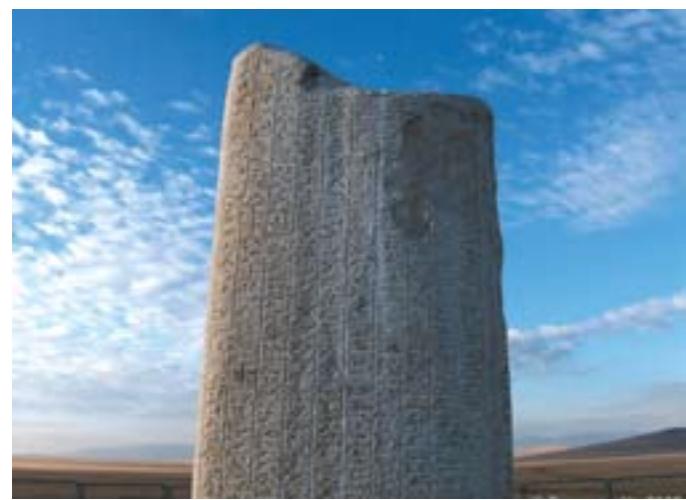
Стела Тонюкука VIII в.

Археологи З. Самашев, К.М. Байпаков, К. Нагроздка-Мейджик, Г. А. Федоров-Давыдов, С. А. Плетнева выявили и изучили городские центры тюрков-скотоводов. Все эти и другие накопленные на данный момент научные факты позволяют подвести под исследования совершенно новую базу, с иных позиций изучить характер государственности и состояние правовых отношений у кок-тюрков.