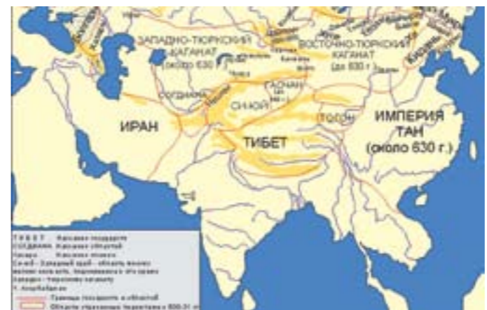
Границы Тюрк Эля (пер. пол. VI в.)