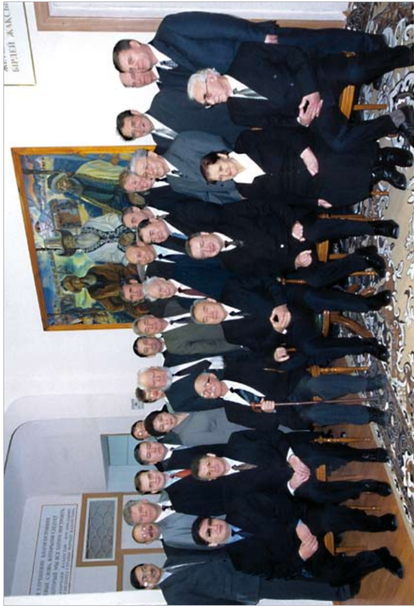
Визит Президента РК Н.А. Назарбаева в Академию «Әділет». 2000 з.