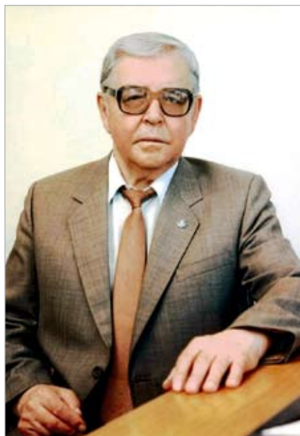
Академик НАН РК Г.С. Сапарғалиев