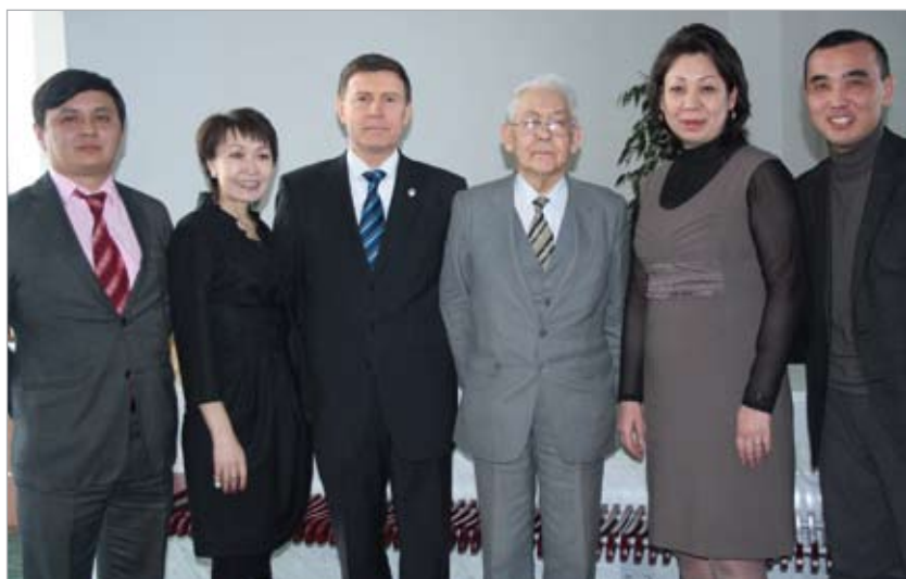
Академик М.Т. Баймаханов с членами кафедры теории и истории государства и права КазГЮУ. 2010 г.