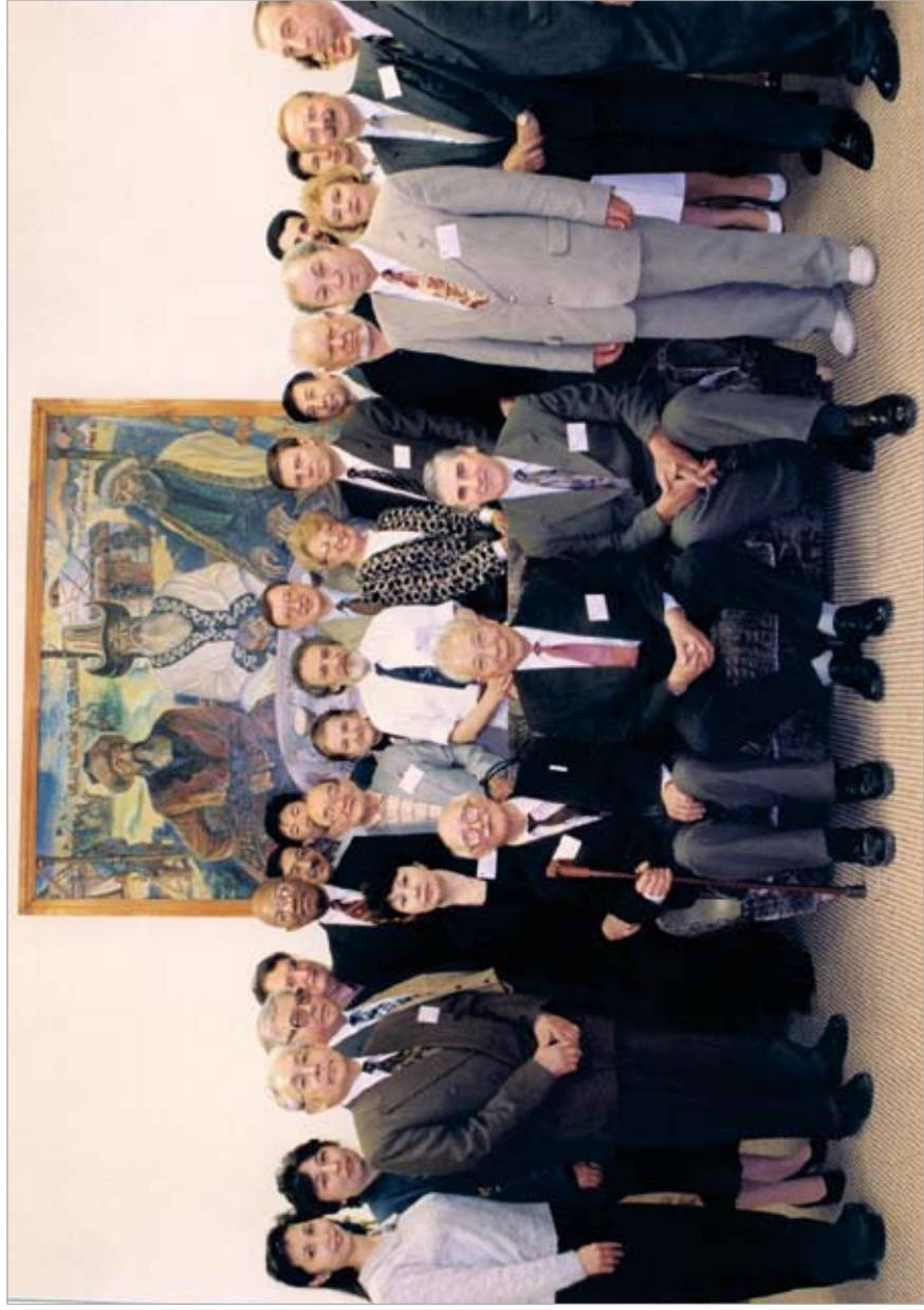
Участники международного круглого стола по правопониманию. Алматы, ВШП «Эділет», 1999 г.