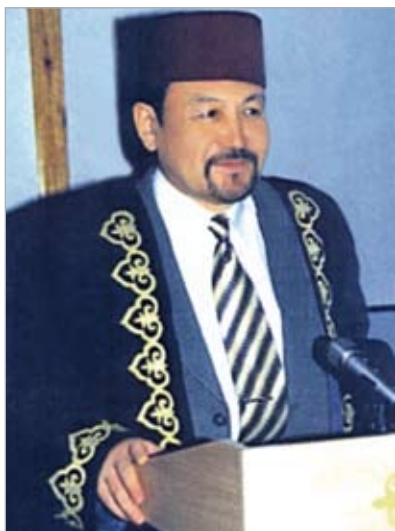
Профессор С.У. Узбекулы.