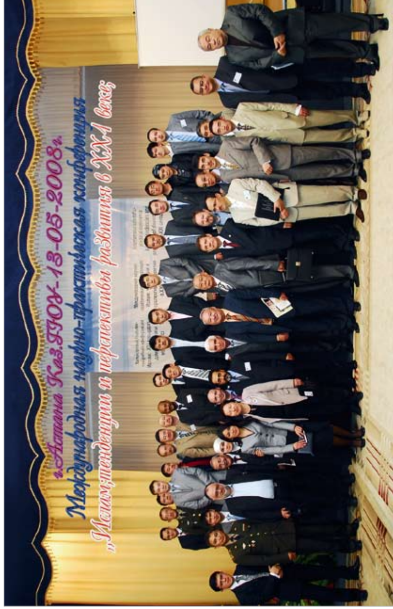
Президент КазГЮУ М.С. Нарикбаев с участниками Международной научной конференции по проблемам ислама. КазГЮУ. 2008 г.