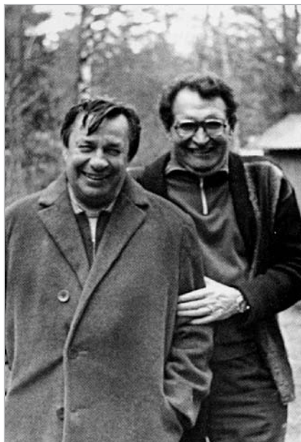
Два классика цивилистики – Ю.Г. Басин и О.С. Иоффе