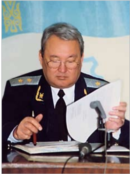
Генеральный Прокурор Республики Казахстан М.С. Нарикбаев