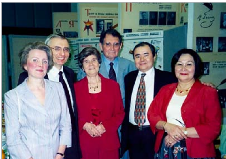
На юбилее профессора Ю.Г. Басина