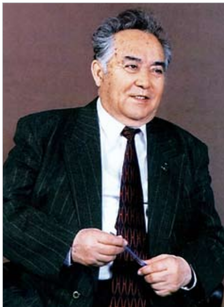
Академик С.С. Сартаев