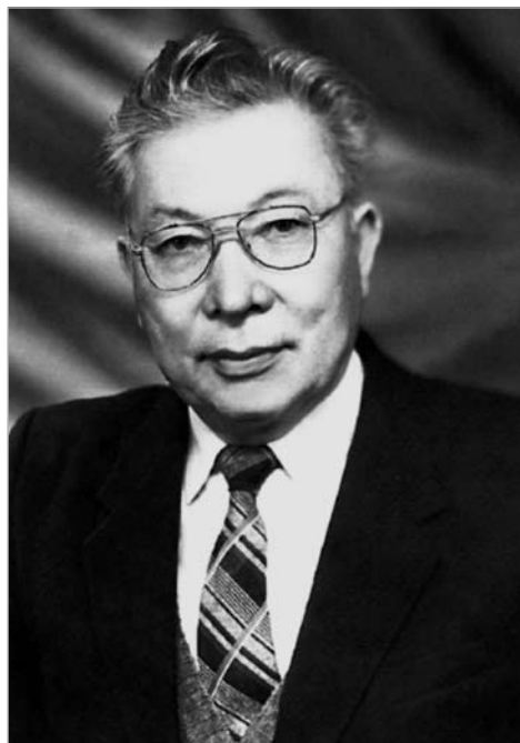
Академик С.З. Зиманов. 1970-е гг.