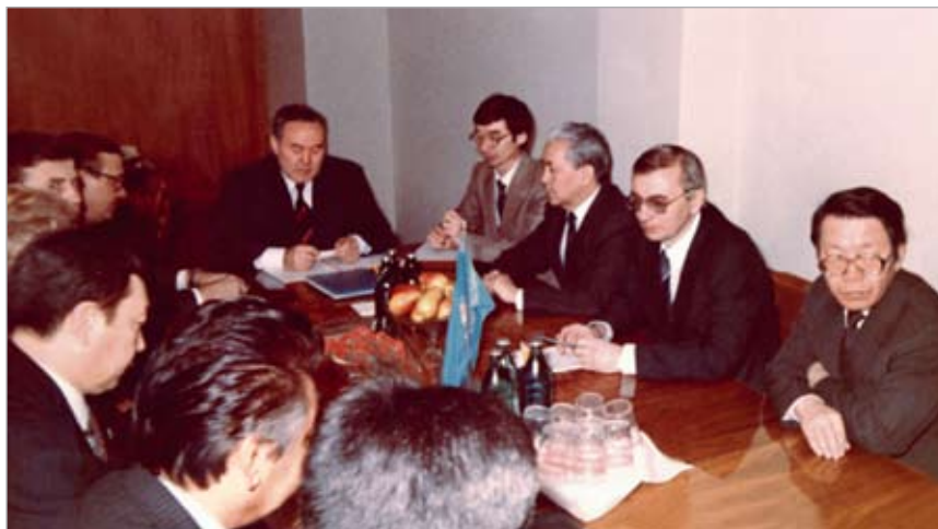
Беседа с Президентом РК Н.А. Назарбаевым во время его посещения Конституционного Суда РК. 1993 г.