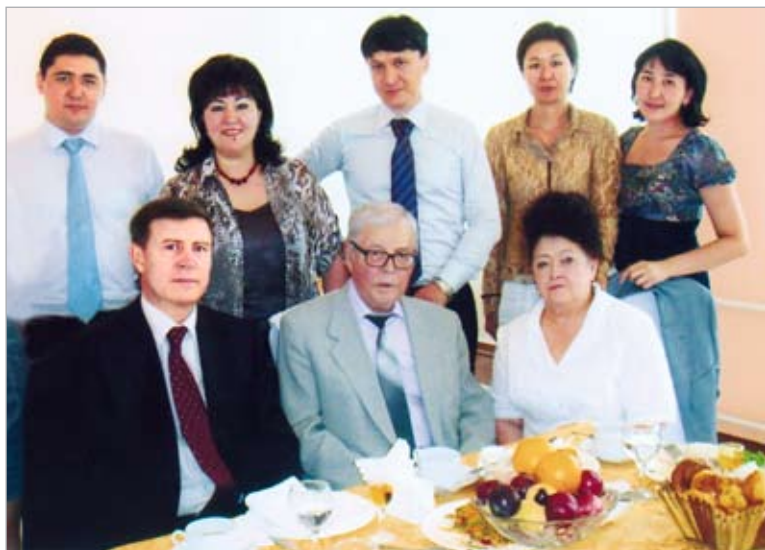
С академиком Г.С. Сапаргалиевым. КазНУ. Конференция, посвященная его 80-летию. 23 июня 2010 г.