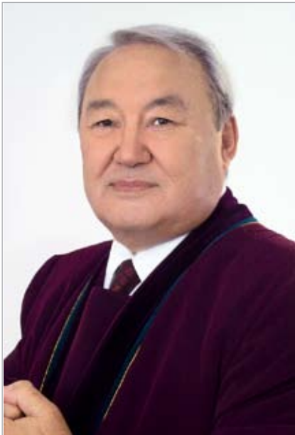
Председатель Верховного Суда РК М.С. Нарикбаев