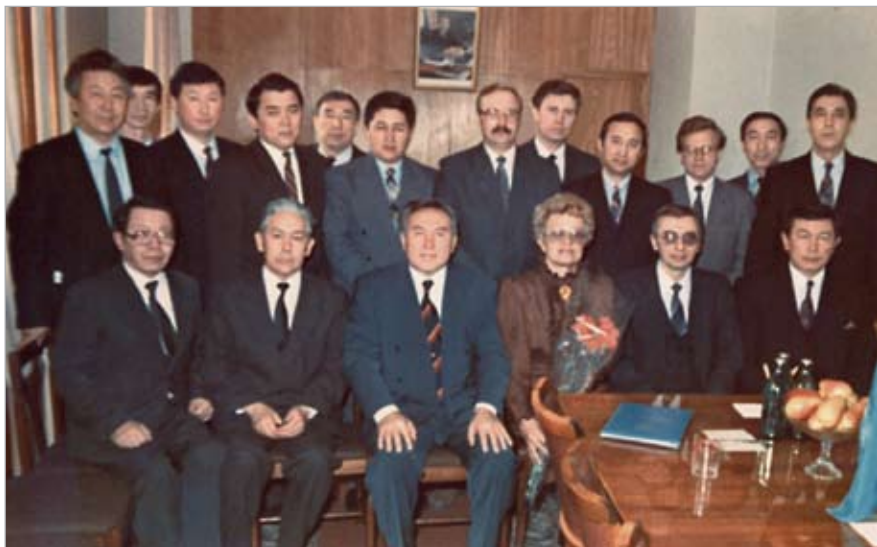
Визит Президента Казахстана в Конституционный Суд Республики Казахстан. 1993 г.