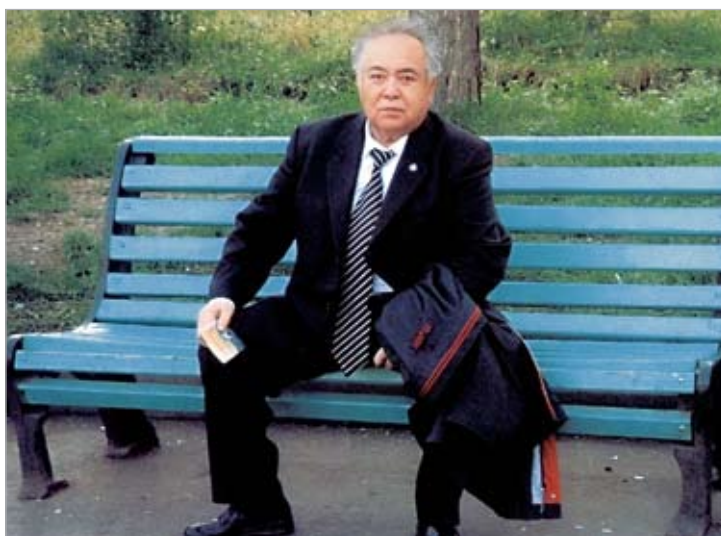
Академик С.С. Сартаев. 2008 г.